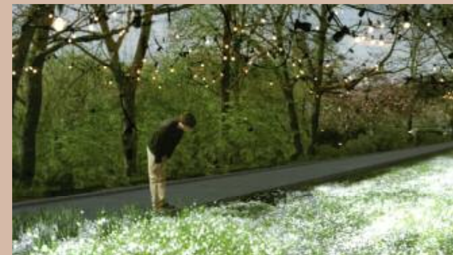
A - « Le jardin aux fleurs blanches »