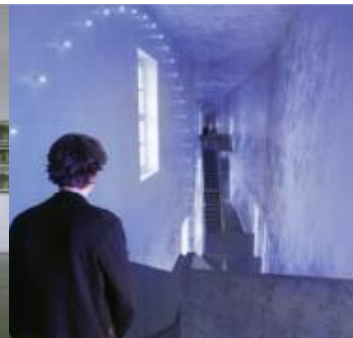
Installation artistique « le cadran »