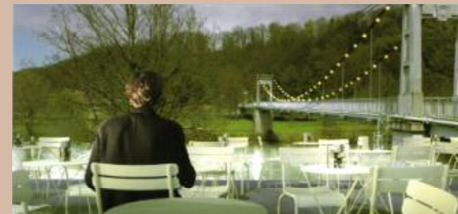
D - « L'auberge verte »