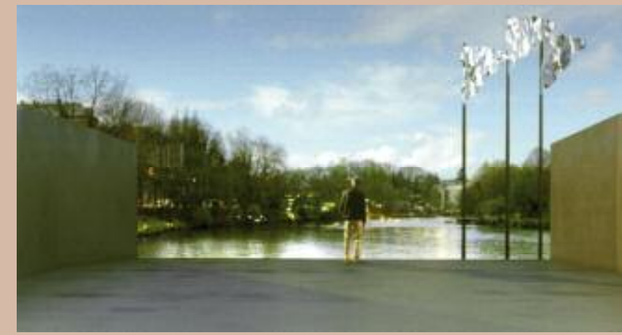
C - « Le belvédère »