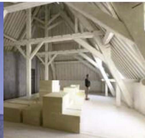
Grenier rendu accessible au public